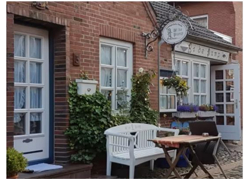
Bi de Pump