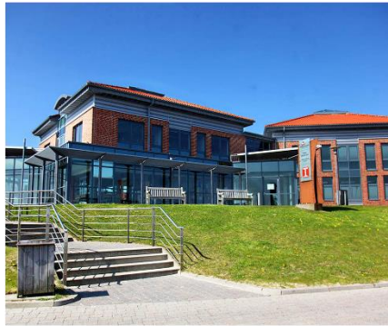
W.D.R. – Reederei